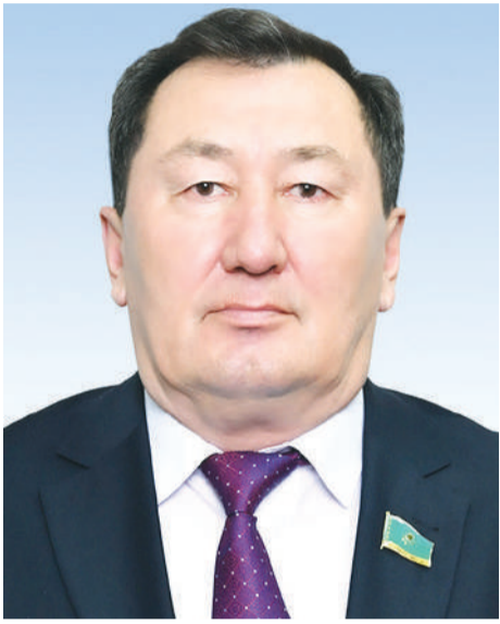
Наурызбай БАЙҚАДАМОВ, Парламент Сенатының депутаты

Еліміз үшін маңызды шешім қабылдау кезеңінде тұрмыз. Эмоцияға берілмей, байсалды әрекет жасап, дұрыс шешімге келудің басты жолы – ақылдасу. «Игі жақсылардың басы қосылса, ақыл арнасы ағытылады» деген сөз бар.